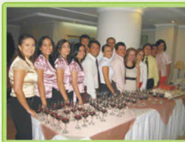
Gerente y Administrativos

A continuación el personal de las diferentes áreas del hotel